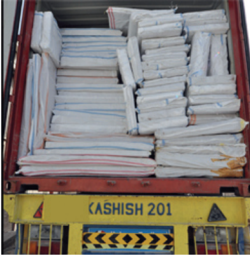
الأسلحة مغلقة بأكياس بيضاء - من المصير

وأشار إلى أن المتهمين كانوا يعتزمون تهريبها إلى إحدى الدول الخليجية أولاً، ومن ثم إعادة شحنها إلى اليمن، لكن عراقيل اعترضت خطتهم، وأجبرتهم على تغيير سير الشحنة، ومحاولة إدخالها إلى دبي لإعادة شحنها مجدداً. واستبعد أن تكون الشحنة موجهة للحكومة اليمنية، لعدم حاجتها إلى مثل هذه الأساليب الملتوية، كما أن الشحنة كانت متجهة إلى صعدة الكامنة أشمال اليمن، والتي تعد من أهم مراكز تجارة السلاح في