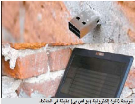
شريحة ذاكرة إلكترونية (يو اس بي) مثبتة في الحائط.

وتحوي الشرائح تلك ملفات موسيقية وملفات صور وأفلاما يمكن لأي شخص ان يقوم بتحميلها من الشريحة او ان يقوم بنقل مواد خاصة به يريد إتاحتها للمشاركة الى الشريحة، وكانت أول قطرة ميتة تم تثبيتها على حائط بمدينة إرفورت الألمانية. وتعد مسألة العثور على القطرة الميتة في إرفورت كالبحت عن كنز، لكن إحدى الصور الفوتوغرافية المنشورة على الإنترنت تظهر شريحة إرفورت وهي بارزة من جدار