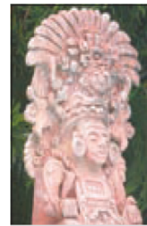
التمثال من آثار الجدل

واتهم جاك بلازي الخبير الفرنسي في آثار أميركا الجنوبية القديمة الحكومة المكسيكية بتعمد التشكيك في حقيقة أي أثر يباع عن الحضارة المكسيكية القديمة حتى تدمر سوق بيع الآثار المكسيكية القديمة لكي تتمكن من استعادة هذه الآثار بأثمان بخسة رغم أنها آثار خرجت من المكسيك بصورة شرعية.