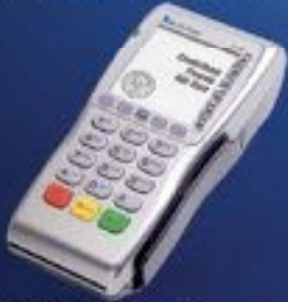
VERIFONE VX 670

24 hours customer service & technical support