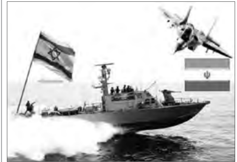
خطوط ودفع سوية مع رئيس الوزراء، بنيامين نتنياهو، إلى شن هجوم عسكري ضد إيران، بادعاء أنها تطور برنامجاً نووياً عسكرياً، بل قال خلال مقابلة نشرتها صحيفة "يديوت آخرونوت" في نيسان (أبريل) من هذا العام، إن هدف الهجوم كان جعل الأمريكيين يشددون العقوبات على إيران لتنفيذ العملية العسكرية أيضاً. وأنا كنت صقريا (أي الهاجرين، لذا علينا تعزيز التعاون أكثر من أي وقت مضى.

بعدها قتل حارس دبلوماسي اسراييلي اثنين من الاردنيين بدم بارد فيما غادر يعد اليها للأسبوع التاسع على التوالي .