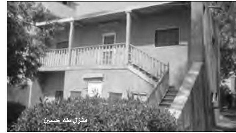
منزل طه حسين