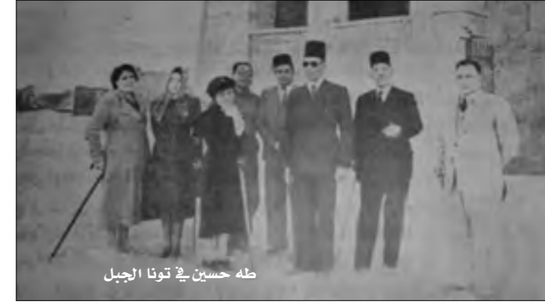
طه حسين في تونا الجبل