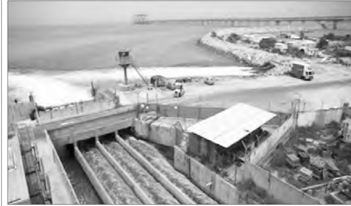
شبه منقطعة في الاطار الدبلوماسي منذ حادثة جريمة السفارة الإسرائيلية

بعدها قتل حارس دبلوماسي اسراييلي اثنين من الاردنيين بدم بارد فيما غادر يعد اليها للأسبوع التاسع على التوالي .