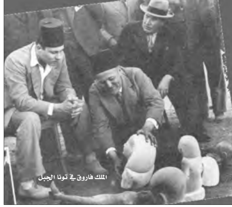
الملك فاروق في تونا الجبل