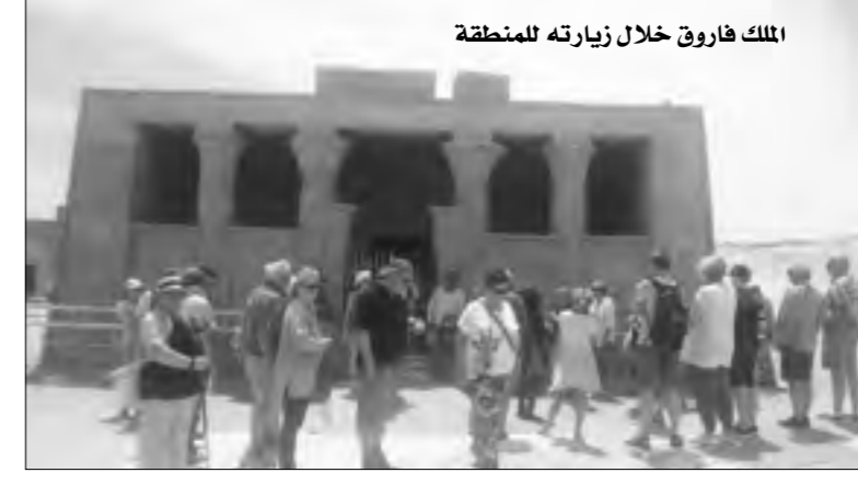
الملك فاروق خلال زيارته للمنطقة

كان يقوم كل يوم خميس بزيارة المقبرة وإيقاد الشموع وإطلاق البخور، مضيفاً أن القصة برمته أعجبت عميد الأدب العربي وزاد من إعجابه بها أنها وقعت بالقرب من مسقط رأسه في محافظة المنيا، لذا قرر بناء منزله على بعد 500 متر من المقبرة، وكان يدعو إليها