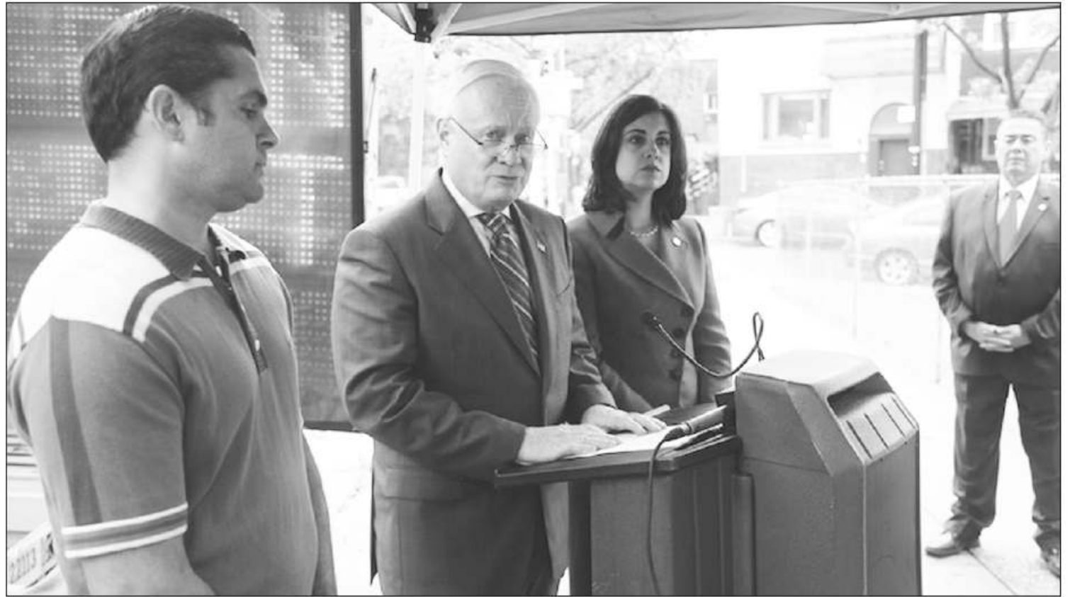
السناتور كولدن يتحدث للصحفيين من مكان الحادث

فسيكون عقابه شديدا وستكون جريمته لا تقتصر، كما شدد كولدن على العمل سن قوانين اكثر صرامة لكل من تسول له نفسه ترك مكان الحادث والهروب في نفس الوقت اشارت السيدة نيوكول المسؤولة العامة في جمعية نيويورك عن منطقة بيريدج وستاتن اينلد على السائقين ان يدركوا انهم عندما يدهسون مارك الطريق في حادث لا يدركون انهم يقومون بضربه بسيارة يقوق وزنها على الاربعين الف طن وهي الة قاتلة لذا عليهم ان يعرفوا ان تركهم في مكان الحادث قد يؤدي الى الوفاة المؤكدة ولكن في حالة انقاذ المصاب فان هناك فرصة لانقاذ ارواح المواطنين، لذا تهيب السيدة نيوكول بجميع السائقين بالوقوف والعمل على مساعدة المصابين في حالة الحوادث الغير مقصودة واذاف الى ان الحادث يقع قضاء وقدر وان اسمه حادث ولكن في حالة مغادرة المكان وعدم مساعدة المصاب فهذا لا يعتبر حادثا بل جريمة شعاع يعاقب عليها القانون وشدت السيدة نيوكول على سن قوانين جديدة لعاقبة المخمورين ومتعاطي المخدرات الذين يستعملون سياراتهم وهم في غير واعي وذلك بسب ارتقاء نسبة الحوادث الدهس في منطقة بيريدج بسب تعاطي بعض الناس الخمر والمخدرات خلف مقود السيارة