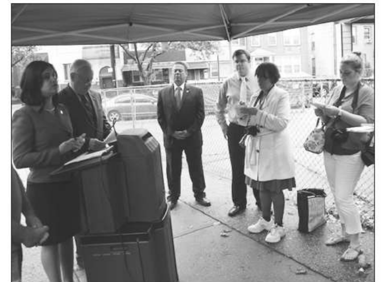
المؤتمر الصحفي ومكان وقوع الحادث المؤسف