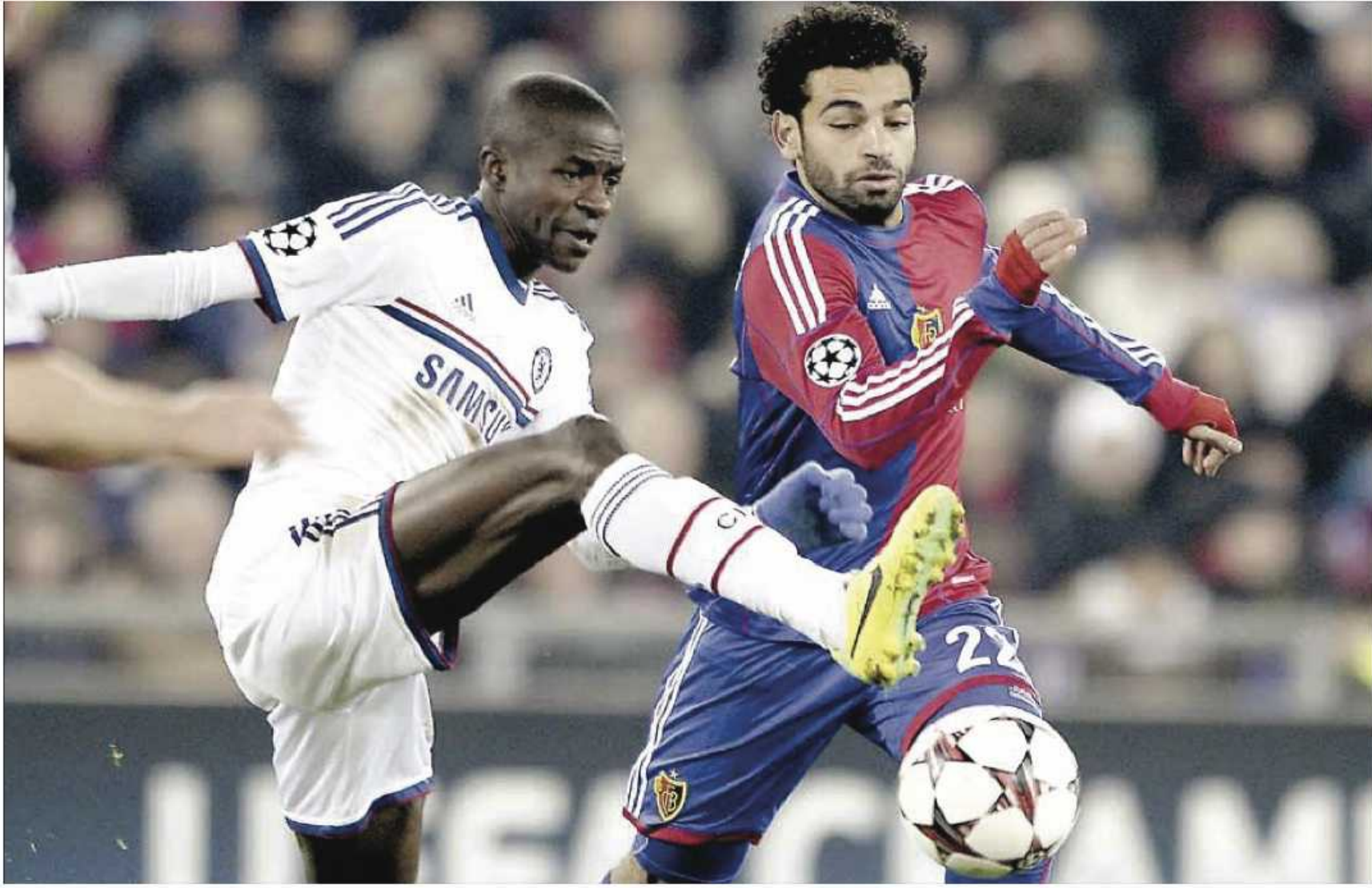
يصعب وقف محمد صلاح في كل أرجاء الملعب